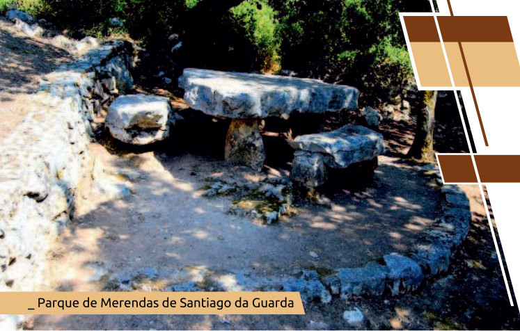
_ Parque de Merendas de Santiago da Guarda