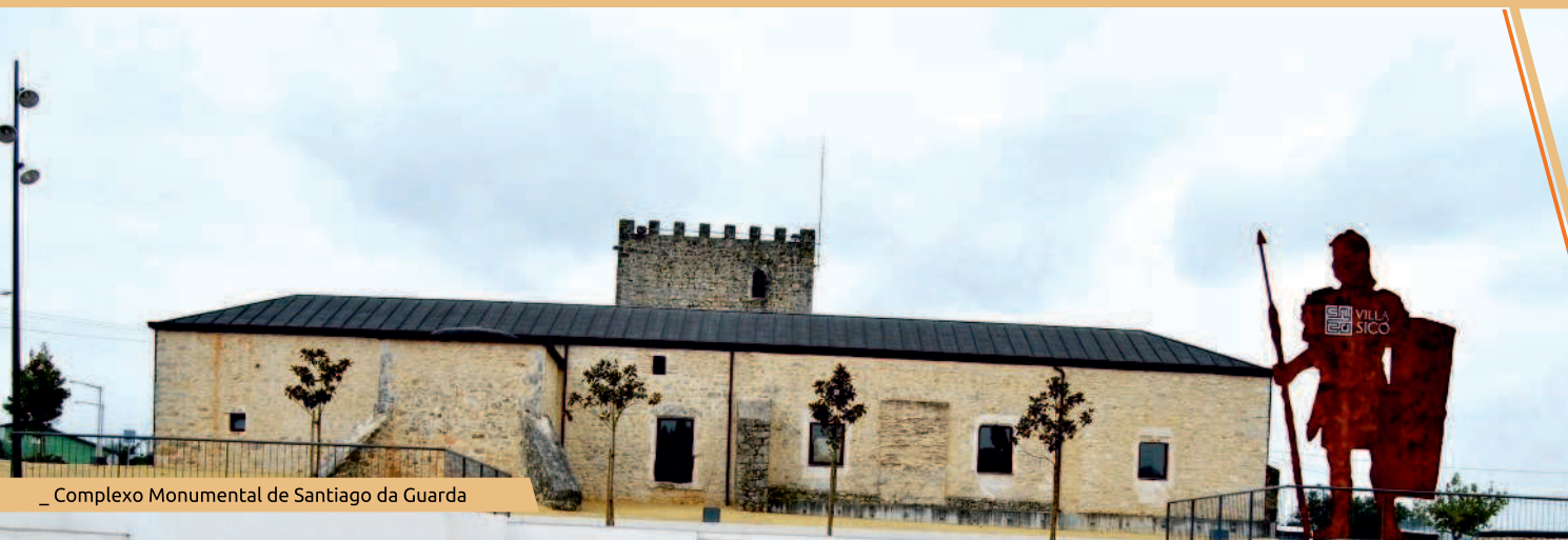
_ Complexo Monumental de Santiago da Guarda

Distância 17,500 km Duração 4h15 Grau de Dificuldade 4 Dificil _ variante 8,650 km | 2h00