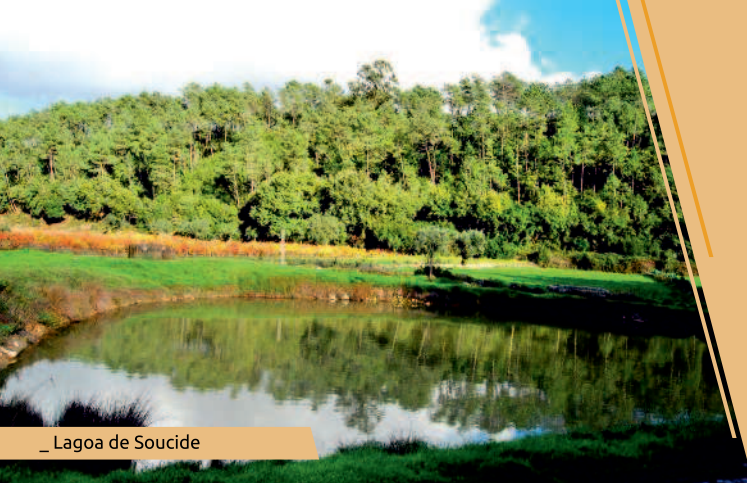
_ Lagoa de Soucide